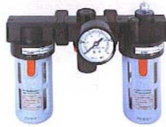
▲兩件式油水分離濾清器